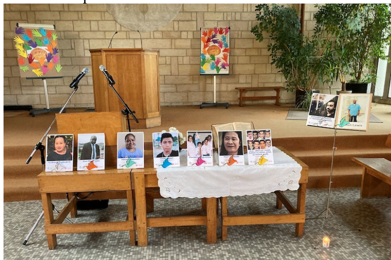
Les oiseaux fleuris déposés devant les portraits des victimes symbolisent la prière qui montait pour elles.

La tombée du jour de ce vendredi 23 juin était le moment adéquat pour réunir nos paroisses chrétiennes de Massy et des alentours au temple de l'Église protestante unie à Palaiseau en une veillée de prière recueillie et fervente autour des victimes de la torture et de traitements injustes et dégradants. Nous répondions à l'appel de l'ACAT, Action des chrétiens pour l'abolition de la torture , ONG chrétienne de lutte contre la torture et la peine de mort. Depuis 18 ans, chaque année, l'ACAT convie tous ses membres et ses sympathisants à une « Nuit des Veilleurs ». Dans chaque pays, une préparation spécifique s'adresse à tous les groupes ACAT et leur fournit suggestions et documents pour s'unir à cette manifestation d'ampleur mondiale.