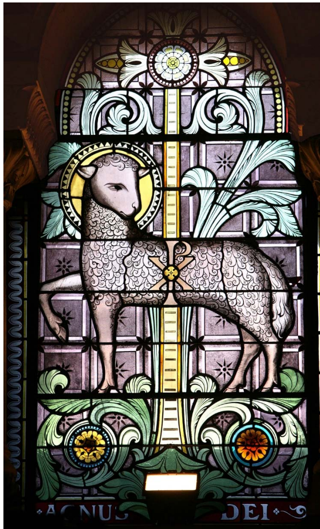
Agneau pascal, crypte de Fourvière